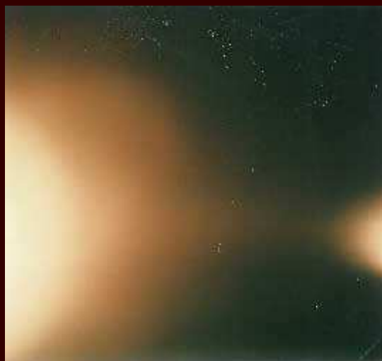
Cliché n° 2 (original)

Cela ne cadre plus du tout, d'autant que le cliché n° 2 (ou A pour Jimmy) ne correspond pas à la forme du n° 2 que j'ai en ma possession. (Voir ci-dessous). Prenez le livre de Guieu et suivez-moi un instant : Nous constaterons que le cliché n° 2 (le vrai - donc le mien n° au verso) rappelle plutôt les n° 5 et 8 (soit B et C).