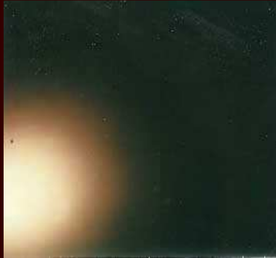
Cliché n° 3, inconnu ...sauf des mains de Jean-Pierre...