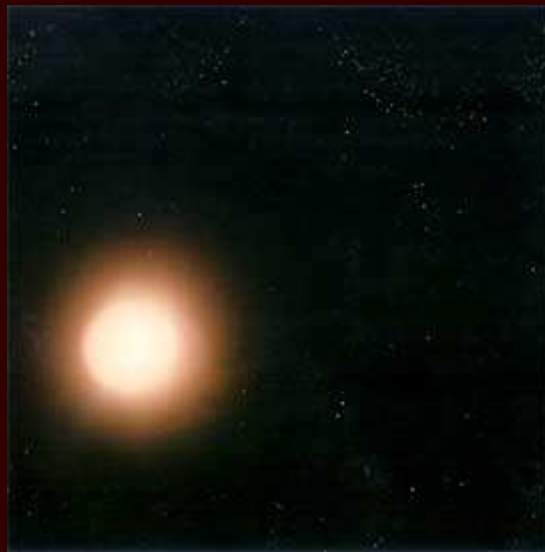
Cliché n° 7- Original...